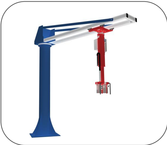
TELESKOP Manipulator im Schwenkausleger